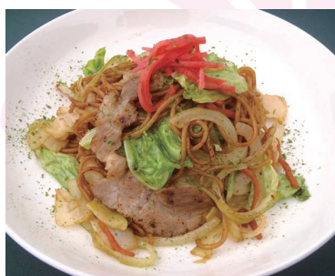
ガーリック焼きそば 600円 ニンニクが香ばしい ボラガーの鉄板メニュー