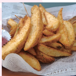
スパイシーポテト 450円