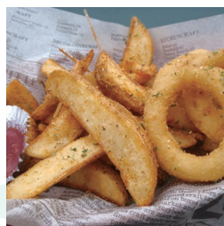
スパイシーオニポテ 450円