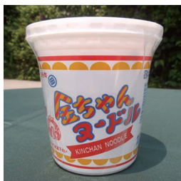
金ちゃんヌードル 250円