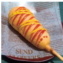
アメリカンドッグ 160円