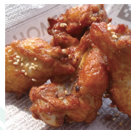
ガーリックフライドチキン 450円(5ヶ入り)