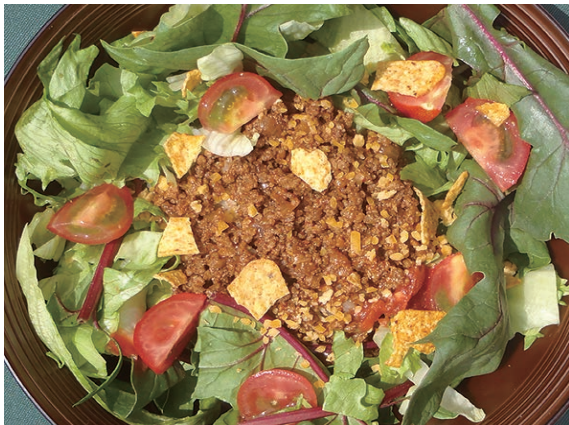
タコライス スープ付 800円 沖縄発のソウルフード